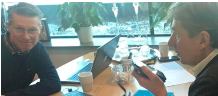
Så här såg det ut när region Örebro höll sitt regionmöte.

– Min förhoppning är att vi kan bjuda in till nya medlemsträffar under hösten för att prata vidare om arbetet i den ekono- miska föreningen, vad som är på gång och utvecklingen framöver, hälsar Per-Olof.