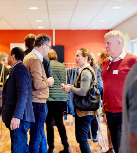
Förtroendevalda samlade på Lundsbrunn utanför Skara.